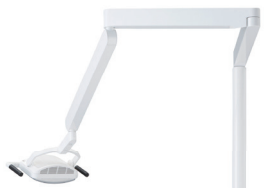
歯科用ユニット スペースラインST BM