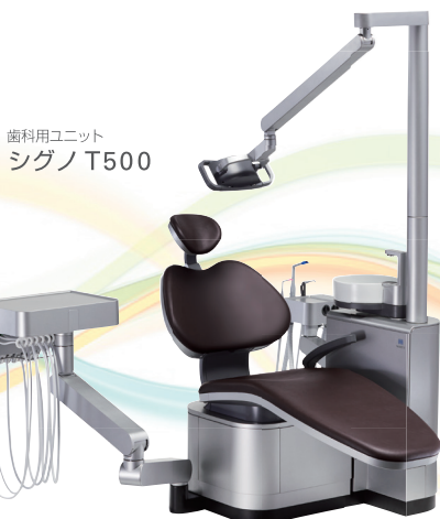
歯科用ユニット シグノ T500