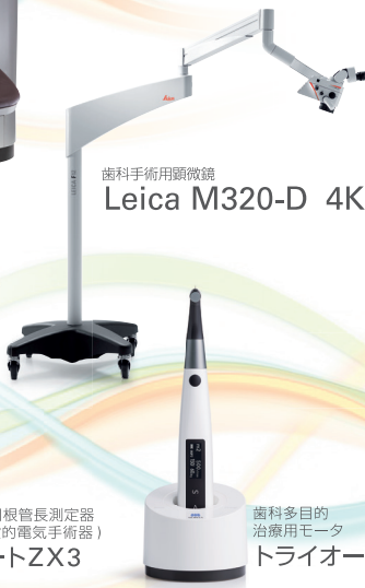
歯科手術用顕微鏡 Leica M320-D 4K