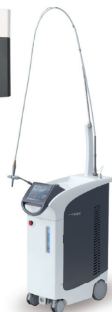
歯科用 Er:YAG レーザー装置 アーウィン アドベール EVO