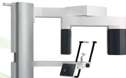
歯科用デジタルパノラマ・セファロ・CT X線装置 ベラビュー X800