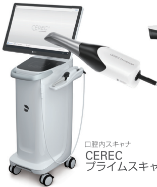
口腔内スキャン CEREC プライムスキャン