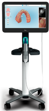
デジタル印象採得装置 歯科技工室設置型 コンピュータ支援設計・ 製造ユニット iTero エレメント 5D Plus