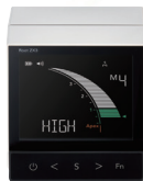
歯科用根管長測定器 (一般的電気手術器) ルートZX3