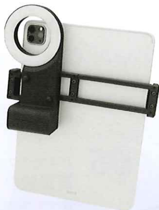
タブレット装着時