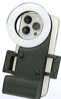
スマートフォン装着時